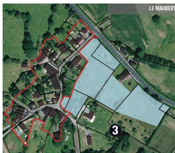
Hameaux dont les surfaces sont fortement augmentées en extension